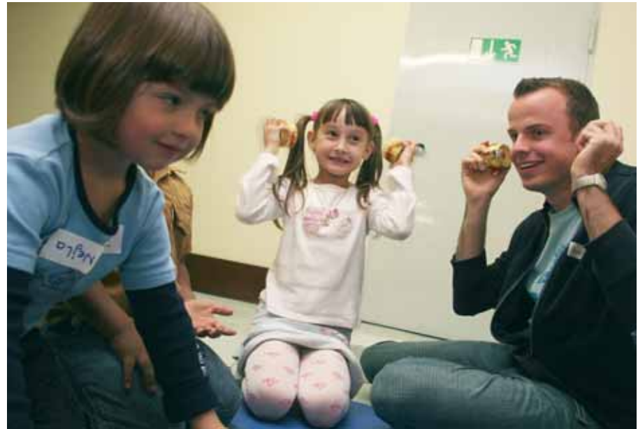
Ein Parcours zum Fühlen, Hören und Schmecken mit Bankpraktikanten

freihalten. Nach seiner Erfahrung sind bei den Mitarbeitern „vor allem handwerkliche Tätigkeiten beliebt, bei denen am Ende des Tages ein Produkt sichtbar ist, auf das alle gemeinsam stolz sein können“.